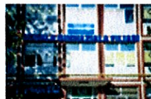
Școala Gimnazială Filiași