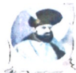
Școala Gimnazială „Mihai Viteazul” Craiova