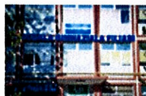
Școala Gimnazială Filiași