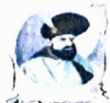
Școala Gimnazială „Mihai Viteazul” Craiova