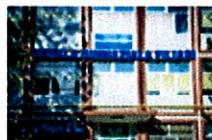
Școala Gimnazială Filiași