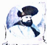
Școala Gimnazială „Mihai Viteazul” Craiova