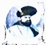
Școala Gimnazială „Mihai Viteazul” Craiova