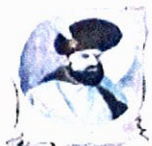
Școala Gimnazială „Mihai Viteazul” Craiova