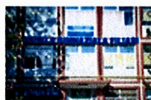
Școala Gimnazială Filiași