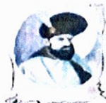
Școala Gimnazială „Mihai Viteazul” Craiova