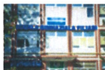
Școala Gimnazială Filiași