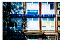
Școala Gimnazială Filiași